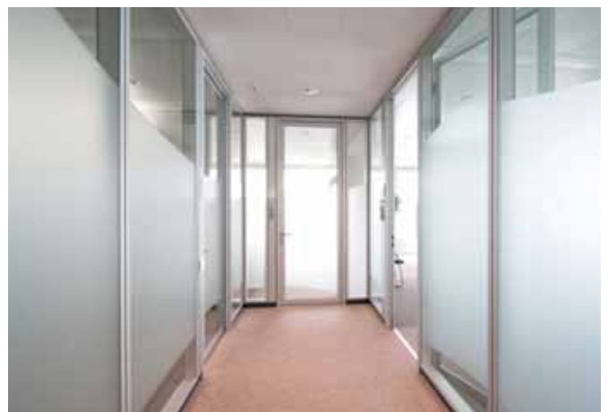
Großflächige Dekorfolienbeklebung als Sichtschutz.