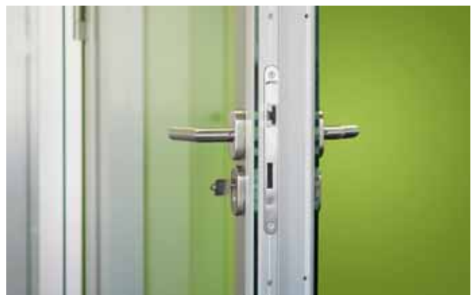
Doppelverglaste Aluminium-Rahmentür mit flächenbündig aufgeklebter Verglasung, passend zum Trennwandsystem Planus clear.

Je nach Anforderung sind zwei Glasrahmenvarianten wählbar – Eine flächenbündig aufgeklebte Verglasung, passend zum Trennwandsystem Planus clear oder eine Verglasung mittels filigraner Aluminiumeinfassung, passend zum Trennwandsystem Planus light.