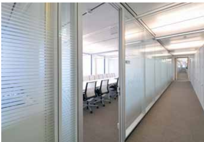
Linienraster – ein edles Gestaltungselement.

Die Glasdekorfolien werden werkseitig im Scheibenzwischenraum aufgebracht und sind dadurch praktisch wartungsfrei. Die Motive können individuell auf die Bedürfnisse und die Wünsche des Kunden angepasst werden.