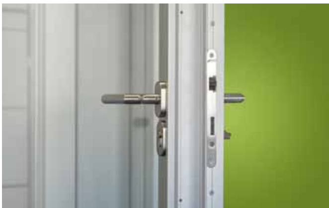
Doppelverglaste Aluminium-Rahmentür mit filigraner Aluminiumeinfassung, passend zum Trennwandsystem Planus light.

Durch den Einsatz unterschiedlicher Verglasungen, Bodendichtungen und doppelter Dichtung im Falzbereich werden in punkto Schallschutz Werte bis Rwp 42 dB erreicht.